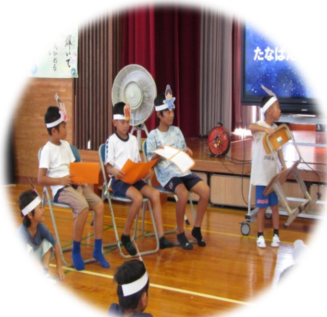
図書委員のみなさん