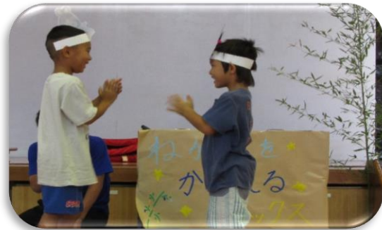
おりひめとひこぼし