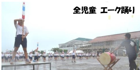
全児童 エーク踊り