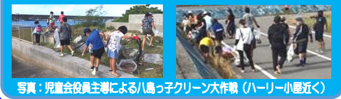
写真：児童会役員主導による八島っ子クリーン大作戦（ハーリー小屋近く）