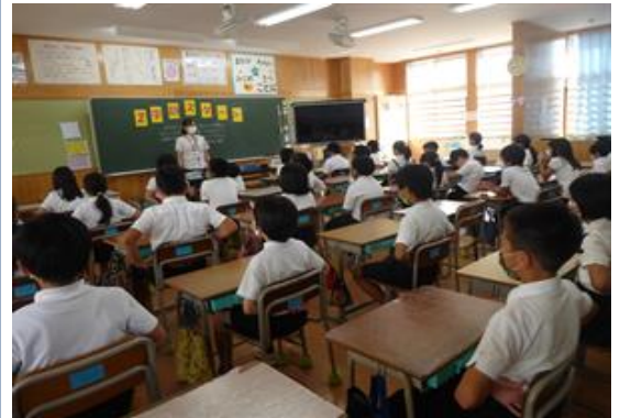
▲校内放送に耳を傾ける4年生

「自分からあいさつ」をテーマにこの2学期、みんなで一致団結し、明るい元気のある登小にしていきましょう。