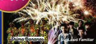
特別開催時間 (最終入場24時)