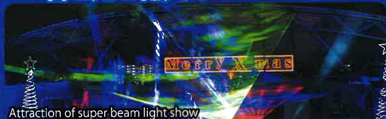
Attraction of super beam light show

日本最大級のレーザー光線ショーが今回もさらにバージョンアップ。超豪華なファンタジックアトラクション。