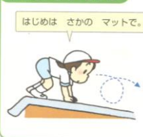
れんしゅうの しかた