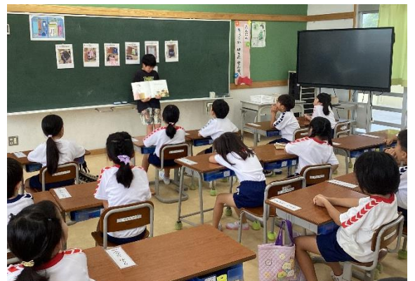
ねんせい よ き 1年生に読み聞かせをしました♪