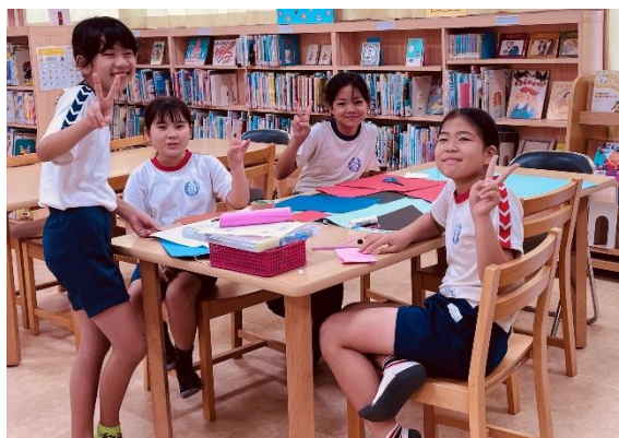
なかよ へん 仲良くしらほっ子カレンダーを作っています！