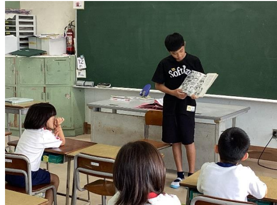
ねんせい よ き 2年生に読み聞かせをしました♪