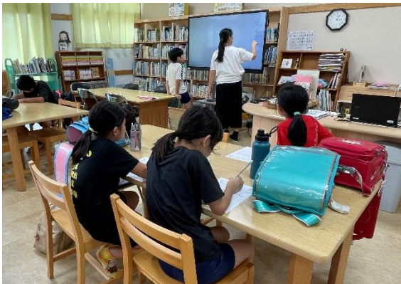
いいん ぞうだん き 委員のみんなで相談してめあてを決めました。