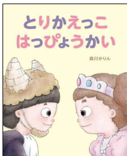
2年生に読み聞かせ予定の絵本 R5 低学年課題図書