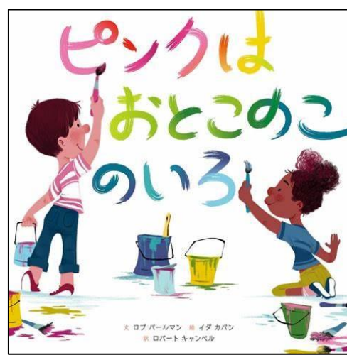
3年生に読み聞かせしました