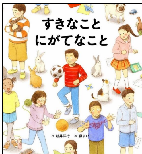
4年生に読み聞かせしました