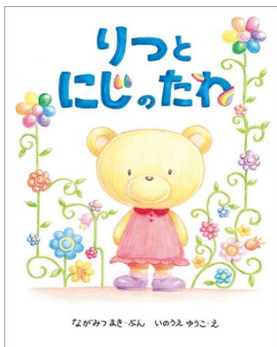
1年生に読み聞かせしました