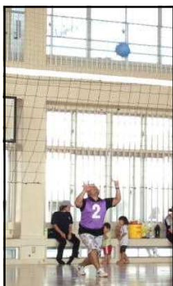
フォームばっちり！

さて、決勝戦は、Aコートからは「現在〇連覇中！」と自力の強さを強調する3班と1班の戦いとなりました。Bコートも2試合圧勝で勝ち上がった1班は、ポイントを取る毎に「…1班！」と合図かけ声の息もぴったりでした。