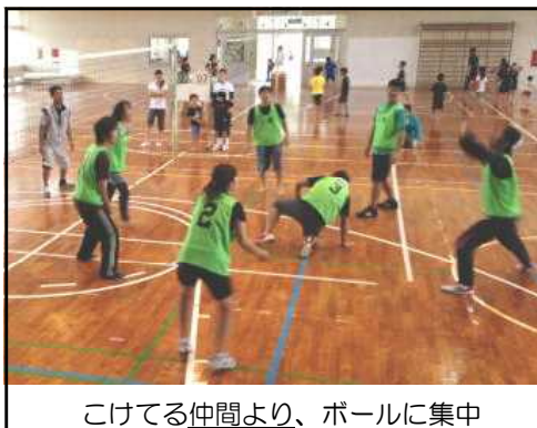
こけてる仲間より、ボールに集中