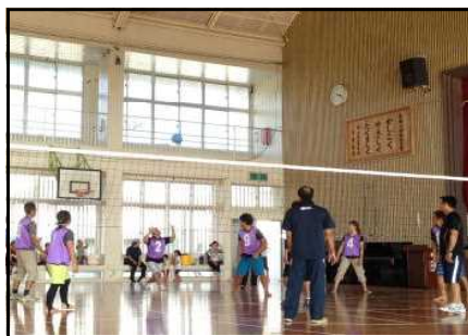
ボールを見つめて固まっている？