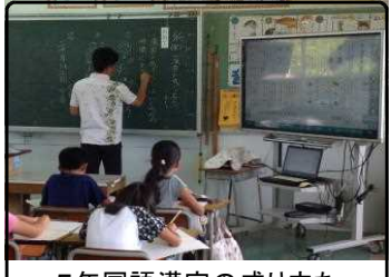
5年国語漢字の成り立ち