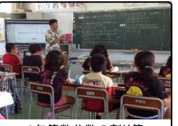
6年算数分数の割り算