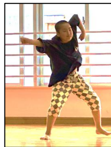
6月19日（水）スピーチ朝会の表現の様子：友達のいいところ、努力の成果など表現のテーマはいろいろ。