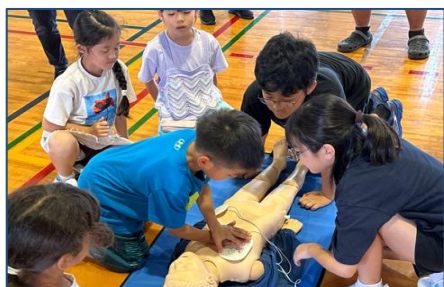
6月4日（火）救急救命教室の様子：児童も先生方もみんな真剣に取り組んでいました。

全国で7万人もの人が「心臓突然死」で亡くなっている現状を考えると素早い119番通報と心肺蘇生、AEDの使用が欠かせません。学校での突然死も報告されていることから、安全な学校を実現するためにも第一発見者になる可能性のある児童への教育は重要だと考えます。また、将来確実に心肺蘇生が実施できるように育成するためには、小学校の段階から繰り返し心肺蘇生を学ぶことも大切だと考えます。