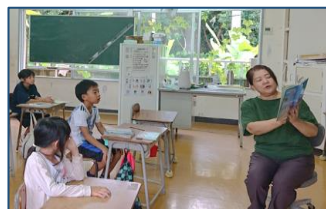
6月4日・11日・18日に、平和月間にもなう全職員による読み聞かせを実施しました。