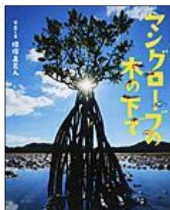
マングローブの 木のうしろ

ひがた 干潟だけでなく、 はやし 林やうみべの生き物たちも くわしくか 書かれています。 これ1冊で生き物ハカセ?!