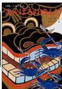
あんぱるぬゆんた

カニたちがあつまって えんかいをひらきます。 はまがに、おかがに、 のこぎりがさみ・・・ それぞれのやくわりに ちゅうもく！