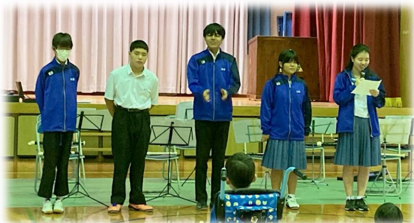
保体整備委員会の中学生が レッドリボンの取組について説明しました！