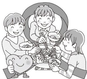
同じものを食べる