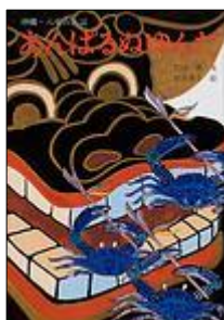
あんぱるぬゆんた

アンパルにいる いろんな生き物の 写真がのってるよ！ みんなは いくつしってる？