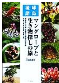
マングローブと 生き物探しの旅