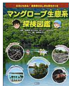
マングローブ 生態系探検図鑑

カニたちがあつまって 宴会をひらきます。 はまがに、おかがに、 のこざりがさみ・・・ それぞれのやくわりに ちゅうもく！