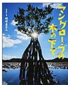
マングローブの 木の下のき

アンパルにいる いろんな生き物の 写真がのってるよ！ みんなは いくつしってる？