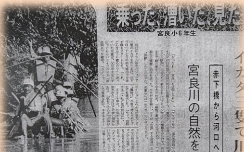
第1回 川下りの記事