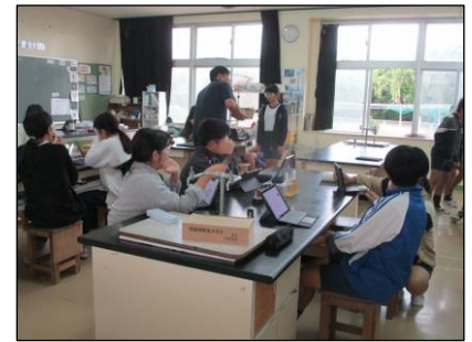
18日 (木) 大浜小学校交流学习会 (5・6年) 大浜小学校の児童といろいろ交流を深めました。