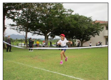
25 (木) 校内持久走大会 完走めざし最後まで頑張りました。たくさんの保護者の皆様、応援ありがとうございました。