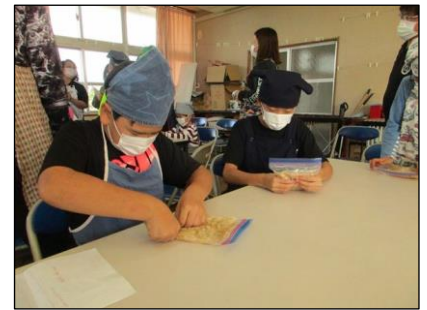
16日 (火) みそ作り体験 JA おきなわ女性部の皆さんを講師に、みそ作りに挑戦しました。