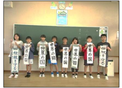
10日 (水) 新春書初め会 一人一人ていねいに作品を仕上げました。上手に書けたかな？