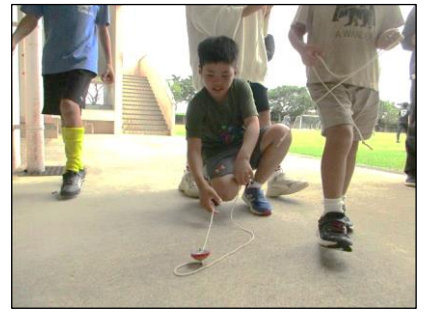
9 (火) 新春お楽しみ会 凧揚げ、けん玉、かるた、コマ回し等、お正月遊びを楽しみました。