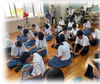
石垣税関支署の方々

夏休み前に、中学生は薬物乱用防止教室に参加しました。税関のお仕事や、薬物の危険性について学習しました。薬物、ダメ、ぜったい！！