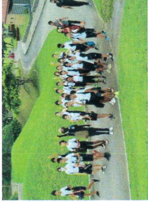
【集合学習(中学校) フットサル】