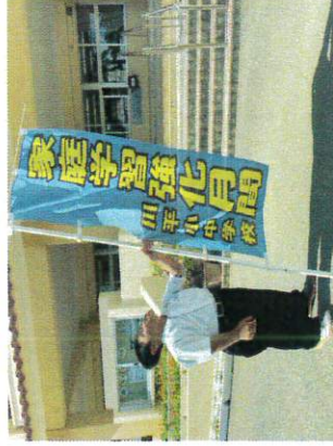
【もちろん勉強もがんばりましたー】