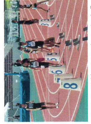
【県中学校夏季陸上大会】