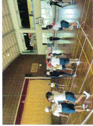
【集合学習(小学校) レク&スーパードッチ】