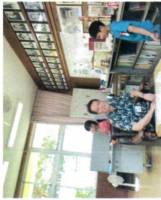
【学校探険(小1) 校長室や職員室も探険だー】