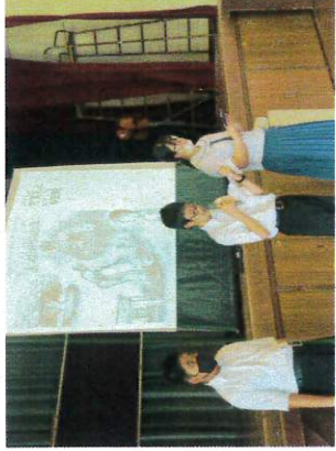
【平和集会：平和と生命の尊さを考える】