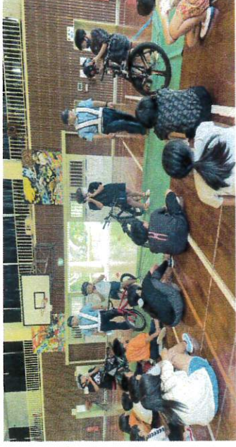
【正しい自転車の乗り方確認しました】