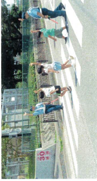
【右見て→左見て→手をあげて渡ったよ】

5/25(木)八重山警察署員を講師に「小学校交通安全教室」を行いました。お話以外にも小学校低学年は横断歩道の渡り方を、そして中高学年は正しい自転車の乗り方なども教わりました。市内でも交通事故が多いです。ご家庭でも交通ルール等、ぜひご指導をお願いします。