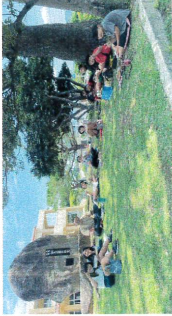
【自分でつくったお弁当は一味ちがう！】