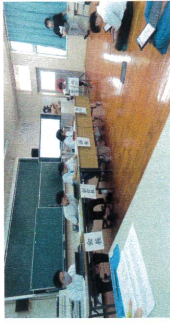
【生徒会総会：意見・質問多数で有意義でした！】