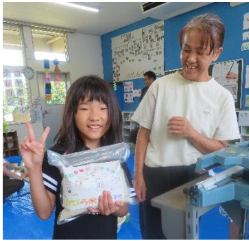
♪お米の袋づめしたよ〜♪