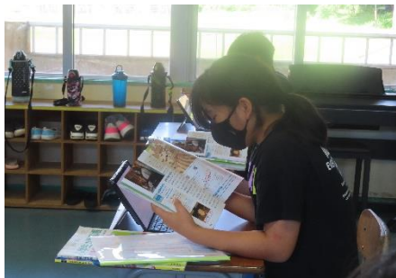
小学校の授業風景