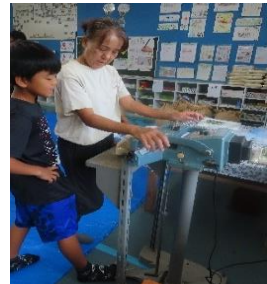
シーラーで口をとじます。10秒数えて