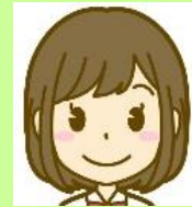
【9年間むし歯ゼロで賞】 中3 女子1人