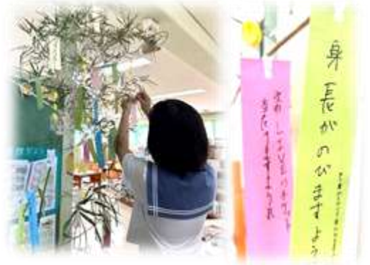
↑ 入口に七夕飾りをする時、みんな目を輝かせて短冊に願いを書いていた！

1学期はどんな本に出会えましたか？夏休みは、読書感想文や感想画の本、普段読まないような長い物語やいろいろな分類の本などを読んでみましょう。また、市立図書館や本屋さんにも出かけてみてね。図書館入口では、夏休みをテーマにした本の展示をしています。ぜひ♪